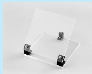
AXCシリーズとストッパー取付台 (AXEシリーズ) (439ページ参照) を使用した場合。